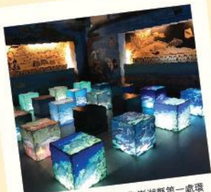
「澎湖吉貝石滬文化館」為澎湖縣第一處環境教育設施場所，提供「認識石滬」、「石滬漁業體驗」、「海域生態」、「人文歷史」、「海洋保護」等教學的課程。

位於吉貝島西南方，為吉貝島上最高的山，擁有至高點的優勢，為吉貝嶼觀賞日落的最佳地點。漲潮時可遠眺目斗嶼、姑婆嶼、鐵崁嶼，退潮時也可清楚展望散佈在吉貝嶼周圍的石滬和潮間帶。