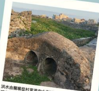
洪水由龍喉從村里流向大海時，淨化水中的邪氣以及災難，為村子帶來平安的生活。