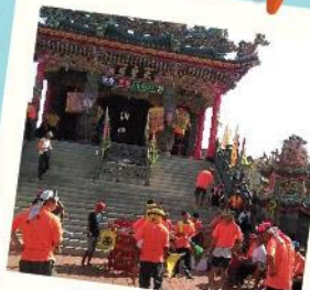
武聖殿—吉貝嶼第一座建立的廟宇

吉貝島上最古老的廟宇，是當地居民的信仰中心，一直保佑、守護著居民，在鄉親的心中有著無比重要的地位，自然也產生了不少的傳說故事。約建於永曆七年（西元一六五二）距今有三百五十年歷史，列祠關、張、趙、馬、黃五虎將，並祠諸葛武侯、關太子，中堂尊奉李、連、符三位千歲中壇元帥太子爺等，也有一些非人物形象的信仰，如：虎爺（驅逐避邪、保護小孩子）和殿前方不遠處的赤兔寶馬。