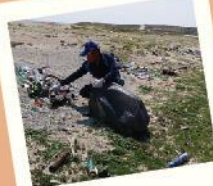
在海邊遊玩 不只帶走自己的垃圾 順手撿起沙灘上的垃圾吧！

請一起這樣愛海洋！淨灘不是停止垃圾污染的終點，卻是每個人親海、愛海與守護海洋的最佳起點，透過淨灘，減少廢棄物進入大海的機會。讓我們一起落實淨灘護生，淨化海洋，共同維護大自然，為地球打造一個健康永續的友善環境。