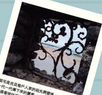
菜宅是吉貝龜戶人家的祖先開墾後，一代一代傳下來的寶庫，依偎著時時石牆成長的菜蔬風味濃。

菜宅是以砌石或玄武岩等砌建的防風牆菜園，少數水源較充沛的村落，如大城北、隘門、太武等則以蘆竹作為防風的設施。澎湖每年十月至翌年三月，東北季風強勁。堆砌石牆最大的目的地，就是為了抵擋強烈的東北季風及其挾帶而來的鹹雨。菜宅的用途除了種植時令的蔬果之外，最主要的就是栽種隔年春天的甘藷種苗，謂之「栽母」。隔年，農曆初春下春雨後，再將「栽母」移植栽種。甘藷，是澎湖居民昔日最重要的糧食作物，《澎湖廳志》因而將甘藷入於穀類。