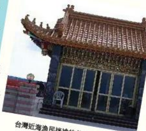
台灣近海漁民迷途的救星—大將爺廟

大將爺本是中國大陸之山神，因水患之故，金身遭受洪流沖入汪洋大海，受盡強風巨浪之衝擊，漂流經過台灣海峽黑水溝，最終隨著風浪海流漂到吉貝嶼的「開礁(西海岸)」海域，而躺臥於海灘上，終被巡海墘(ㄍ一ㄇ、)的漁民拾起代回奉祀。期望「大將爺」能夠發揮神威除魔斬妖，保佑漁民平安順事。