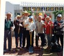
※報名日期：即日起活動前一週額滿則提早結束。※參加好禮：賽事紀念品、水。