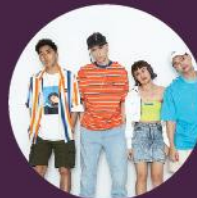
CHING G SQUAD