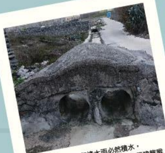
早期在吉貝島上，每逢大雨必然種水，村民請求並依照神明的指示，在島上興建龍喉。

龍喉係整個統稱，建物本身主體包含龍頭之龍鼻、喉嚨與龍身，相傳原本龍鼻上兩側有龍眼，出海口處有兩顆龍珠，今已不復見，不知係年代久遠疏於保存遺失，還是只是傳說。而其綿延近百公尺之溝渠即為龍身，主要係將村子中的汙穢之氣乘著水流一併沖向大海。防洪溝渠之尾端經過東湖，進入村莊後連接「橋仔」，最後經由吉貝福德廟西側出海。龍喉不但具避邪鎮煞象徵，同時亦號稱吉貝風水命脈，亦符合實際排洪需求，特殊景觀吸引眾多遊客駐足。